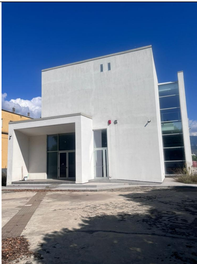
Viste di scorcio